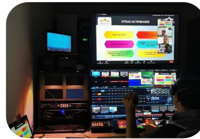
Ilustración 1. Evidencia fotográfica del desarrollo del Tercer Foro de Evaluación Legislativa y Políticas Públicas.