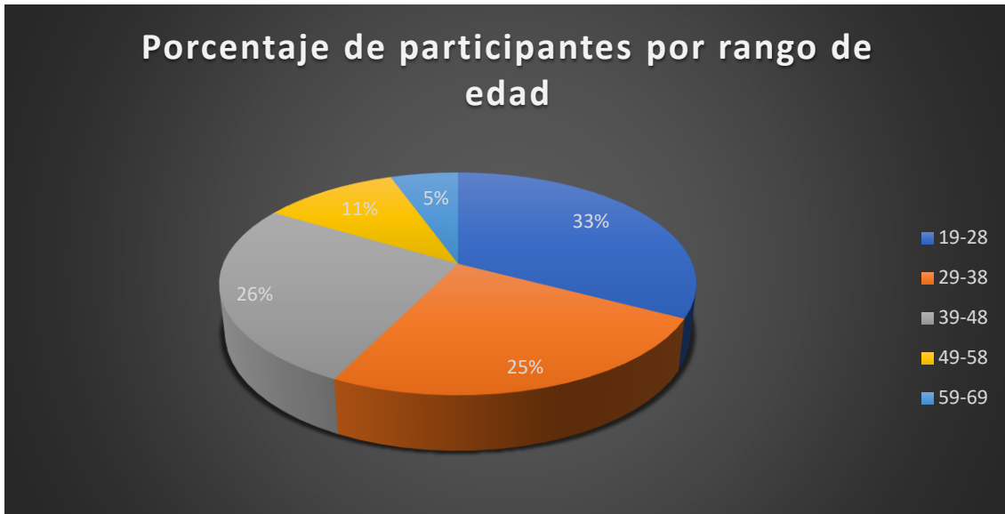
Gráfica 2. Porcentaje de participantes por rango de edad. Elaboración propia.

Desde la perspectiva de la edad de los participantes, el grueso de la población se encuentra distribuida en los siguientes rangos de edad: