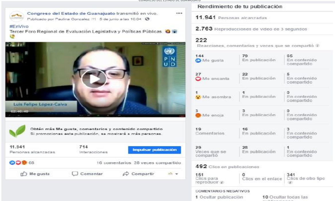
Ilustración 4. Métricas Facebook. Obtenido de Métricas de publicación Tercer Foro de Evaluación Legislativa y Políticas Públicas.