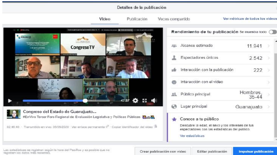
Ilustración 2. Métricas Facebook.