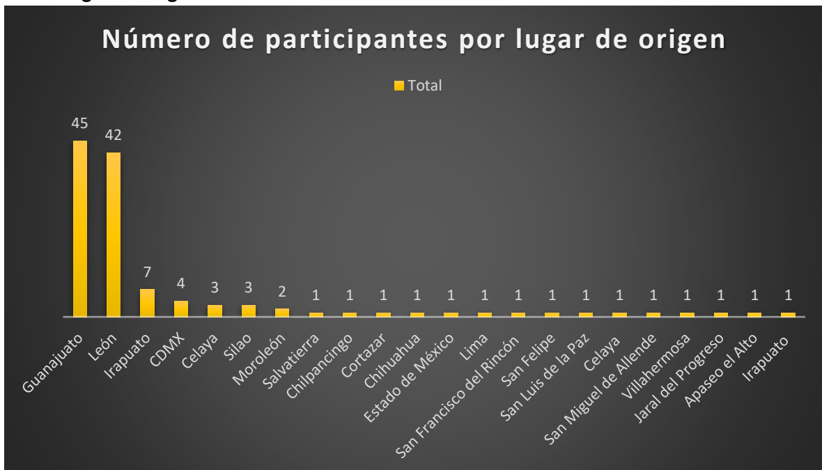
Gráfica 4. Número de participantes por lugar de origen. Elaboración propia.