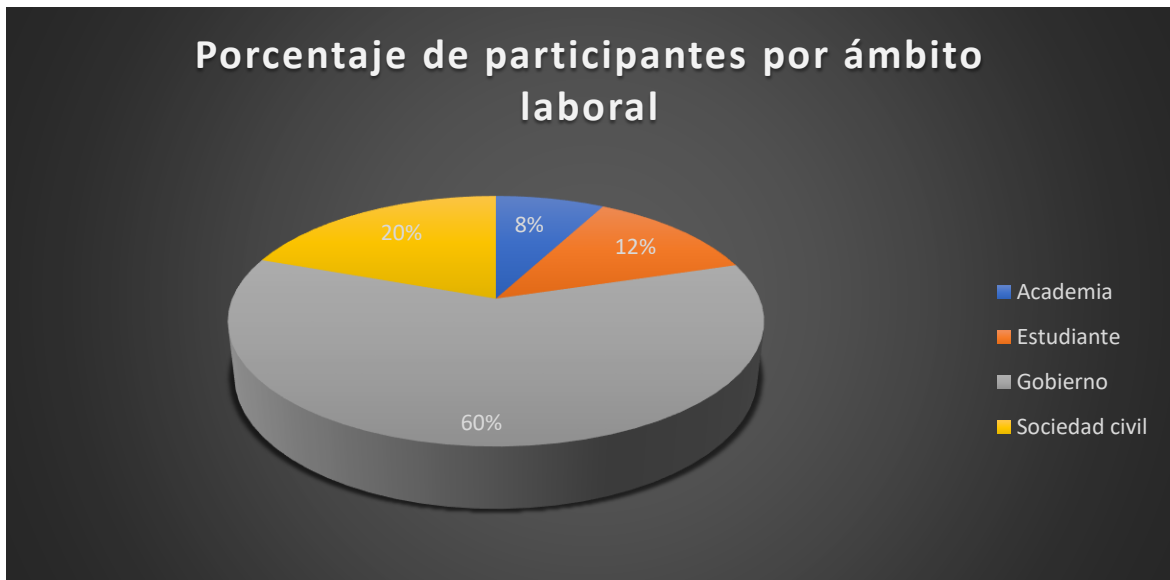
Gráfica 3. Porcentaje de participantes por ámbito laboral. Elaboración propia.

En cuanto al ámbito laboral la mayor cantidad de participantes provienen del sector público y en un segundo lugar de la sociedad civil, este es un dato relevante porque precisamente esa era la temática del Tercer Foro de Evaluación Legislativa, la perspectiva ciudadana.