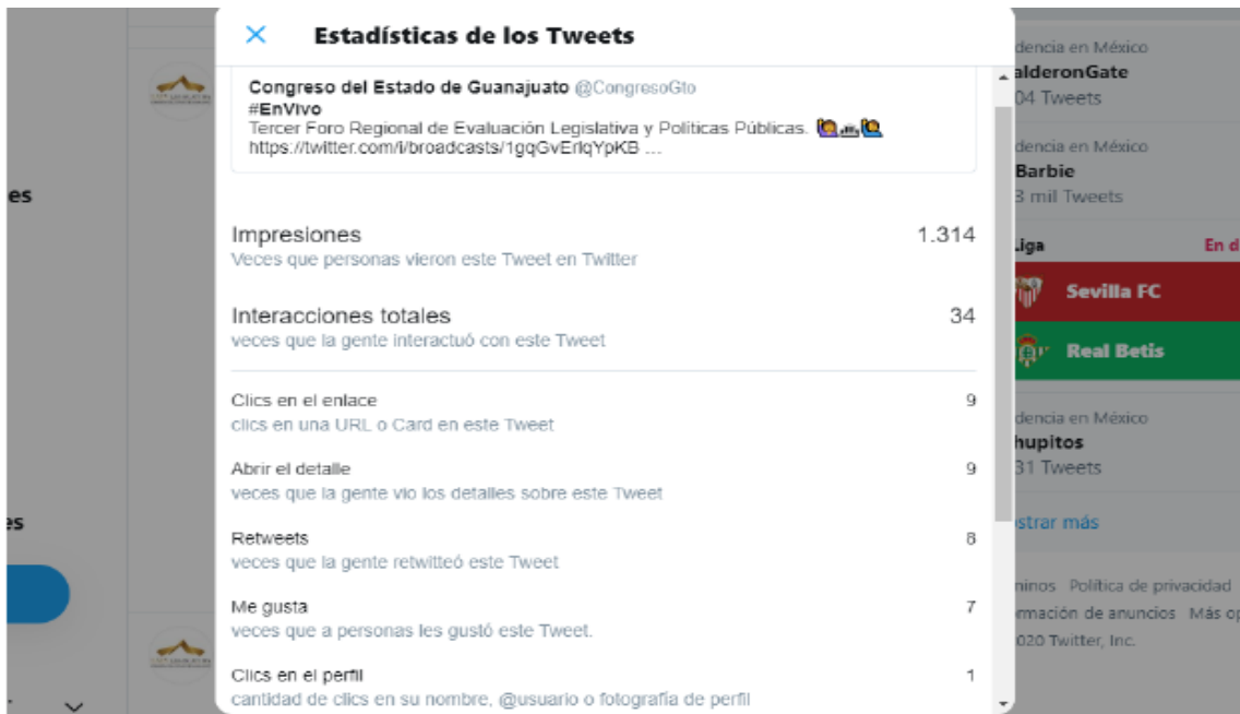
Ilustración 5 Métricas Twitter.

En cuanto a esta red social, se tuvo un alcance de 1,314 personas, 34 interacciones y 9 clics al enlace.