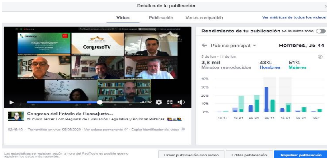
Ilustración 3. Métricas Facebook.